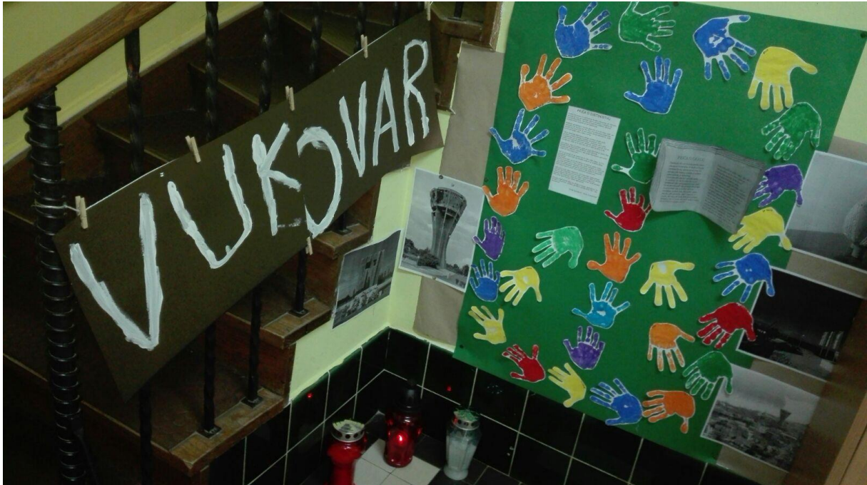
područni objekt „Mali Bukovac“ - Bukovačka cesta 316

Dana, 18.listopada 2016.godine DJEČJI VRTIĆBUKOVAC zapalio je svijeću na spomen svih žrtava grada Vukovara. Obilježen je dan sjećanja na sva tri objekta Dječjeg vrtića Bukovac.