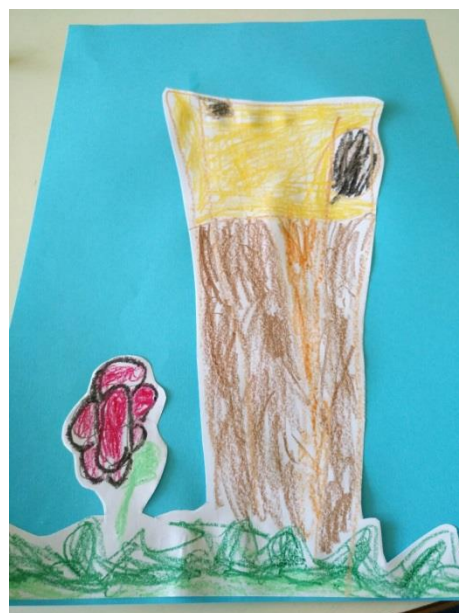
područni objekt „Bukovac na brijegu“ – Bukovačka cesta 221